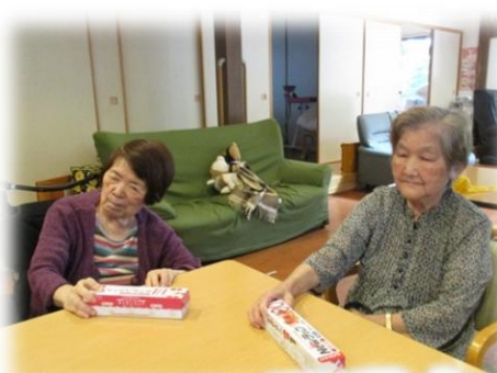
エアホッケー大会