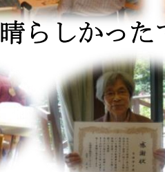
卒寿、米寿、傘寿、おめでとうございます。