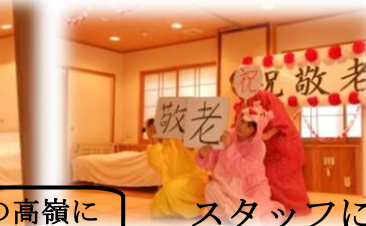
スタッフによる踊り♪