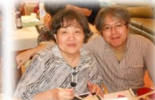
最高の笑顔♪いただきました～！