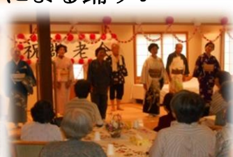
素晴らしかったですね(^O^)