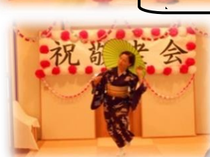
長峰会による演舞♪