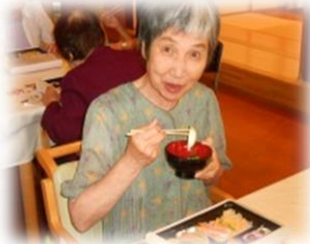
お弁当のお味はいかが？