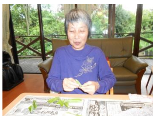
〇〇〇 グリーンピース 剥けた ♡