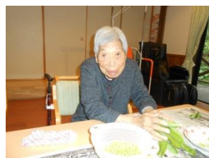
〇〇〇 にこにこ農園収穫