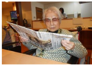
新聞も読まなくちゃ!